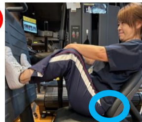
隙間がありません 骨盤が立っています